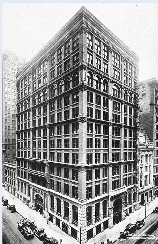
芝加哥家庭保險大樓