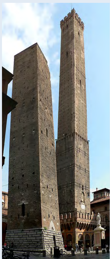
在中世紀建造的「博洛尼亞雙塔」。

雖 然摩天大樓乃是現代社會的產物之一，但這並不表示古人就蓋不起高的建築。早在12世紀，意大利人便建造了「博洛尼亞雙塔」（Towers of Bologna），高達97.2米，可以說是中世紀登峰造極的建築。至於幾千年前的金字塔……無視了吧。它們不算是「樓」。