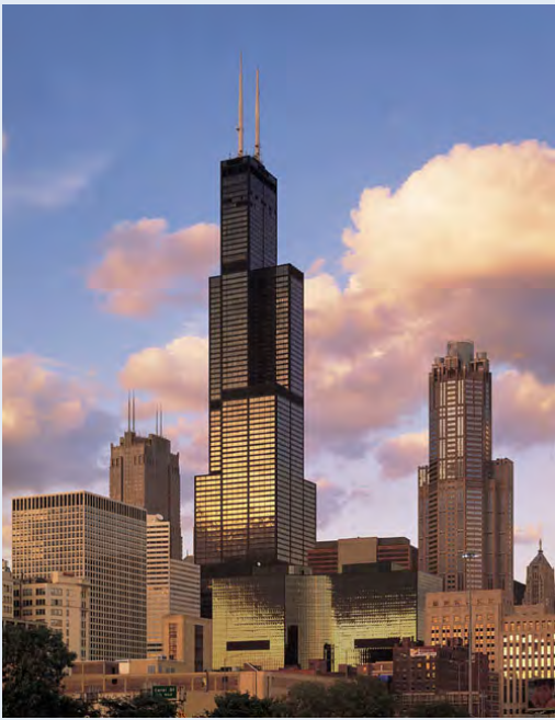
威利士大廈（西爾斯大廈）

一九七四年，位於芝加哥的西爾斯大廈以442米的高度超越了世貿中心，奪取了世界第一高樓的寶座。如果按照屋頂計算，它至今仍然是北美第一高樓（論天線就不是了）。希爾斯大廈是最後一個在美國落成的世界最高建築。馬來西亞的雙峰塔1998年在超越了它。從此「世界第一高樓」的頭銜與美國無緣。