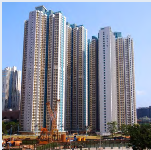
香港牛頭角下邨。在人多地少的香港，即使是普通住宅也可能有二百米高。

摩 天大樓，用嚴肅一點的用詞來講，便是「超高層建築」。大家一聽到這詞語，不消一會便會想到「金茂大廈」、「雙峰塔」等著名地標摩天樓，的確，它們的高度達到數百米，名副其實配得上「摩天大樓」這個頭銜；然而，根據中華人民共和國《民用建築設計通則》規定：建築高度如果超過100米，不論住宅和公共建築都是超高層建築。也就是說，只要你所居住的建築超過三十幾層，你也有可能已經住在摩天大樓裏了！如果你居住的房子只有二十層怎麼辦？不要緊……在日本，建築物超過60米，便是「超高層建築」。把你的房子搬到日本去，你照樣住在「摩天大樓」裏！嗯~