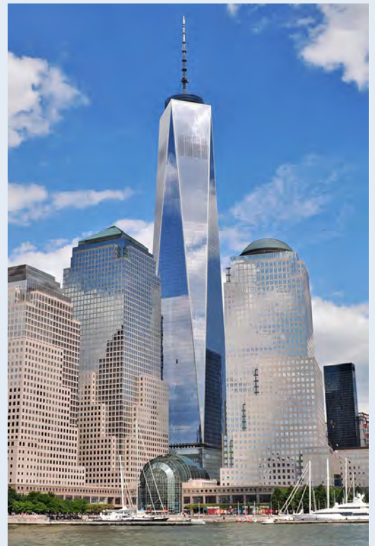
重建後的世界貿易中心一號樓