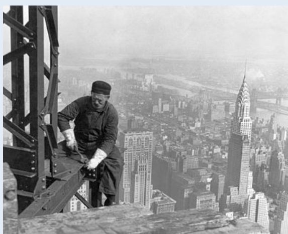
一名正在建造帝國大廈的建築工人