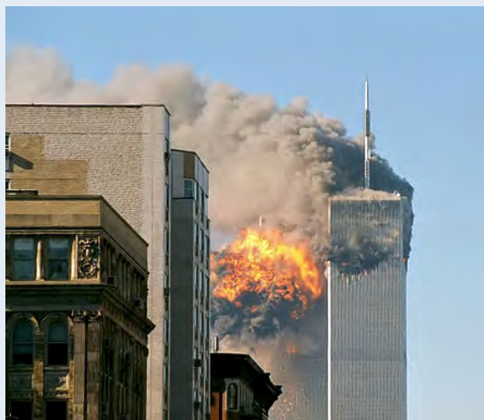
世界貿易中心雙塔遭到襲擊的場景

獨 具特色的電梯設計是世貿中心的一大亮點。兩棟雙子塔高達110層，總共有95座高速和特急電梯，如何令電梯運作得有效率是一大難題。在這個全新的電梯系統中，有兩個專門用來換乘電梯的樓層（44樓和78樓）。人們可以從載客量多的特快電梯來到這兩層樓，再換乘區域電梯。大廈分成若干個樓層區段，每個區段都有自己的專用電梯（區域電梯），而這些電梯可以同時使用同一條電梯管道。這樣的設計令每層的可用面積從62%提高到75%，可謂大有助益。這種設計源於紐約地鐵系統中的快車和慢車，快車只在快車站載客，慢車則在快車站和慢車站載客（就像中國、台灣火車車種也有緩急之分）。