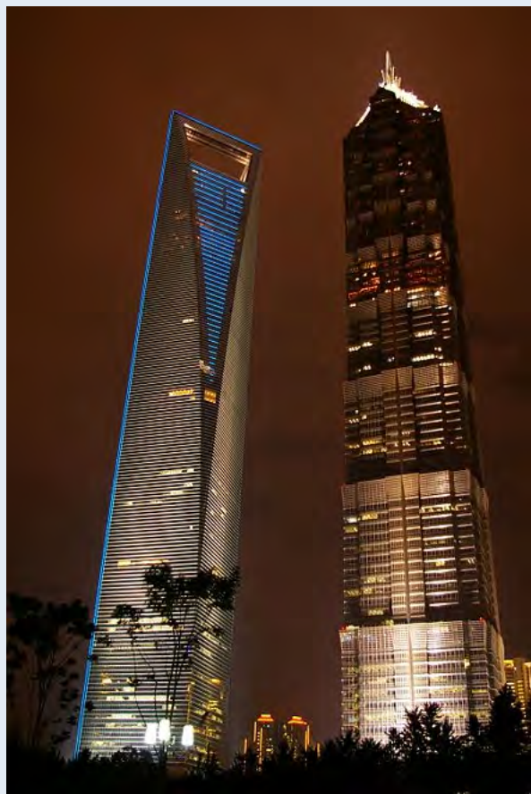
環球金融中心（左）、金茂大廈（右）

2008年，金茂大廈的鄰居——上海環球金融中心奪走了金茂大廈的上海市最高大樓的榮譽。環球金融中心高達492米，甚至超過了東方明珠塔，從金茂大廈那裡搶走了不少遊客和目光。