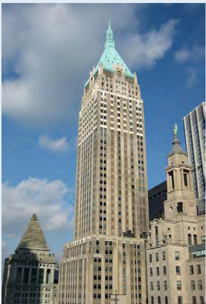
因「裝逼」而遭反超的杜林普大樓 前稱「曼哈頓信託銀行大廈」

第一次世界大戰之後，世界經濟重心從歐洲移到美國，而1920年代是美國建築業的繁盛時期。為了建造世界上最高的大樓，各大建築商充份展現「大躍進」精神，紛紛傾盡全力。然而，第一的頭銜永遠只能屬於一棟樓。